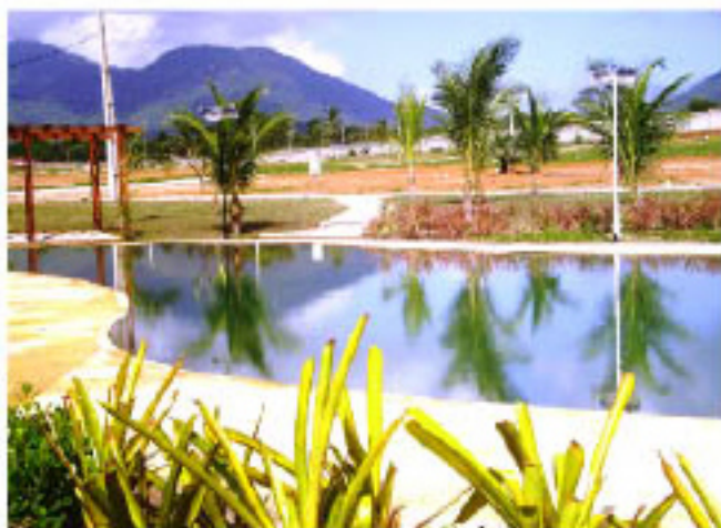
Área de lazer do Jardins de Guaramiranga

Realize seu sonho. Em maio, a Terra Brasilis realiza a entrega oficial do Jardins de Guaramiranga. Felizes, os moradores já estão construindo casas no local. Quem deseja fazer o mesmo, pode solicitar à Associação de Moradores a análise de seu projeto de imóvel. O projeto deve seguir o padrão de excelência Terra Brasilis, seguindo as orientações do Manual do Proprietário do Jardins da Serra.