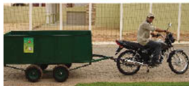
A coleta de resíduos sólidos é realizada duas vezes por dia

Uma ação feita neste intuito foi a Oficina em Coleta Seletiva realizada com as empregadas domésticas das residências do condomínio que aconteceu no último dia 27 de março. O treinamento, facilitado pelo associado e professor da UFC, Sandro Gouveia, teve como objetivo promover a difusão entre as participantes sobre a importância da coleta seletiva do lixo domiciliar ser realizada na própria residência.