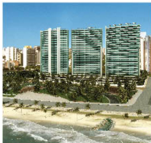
Maquete eletrônica do Riacho Maceió

Em 2008, a Terra Brasilis reforça sua marca, lançando empreendimentos diversificados e de alto padrão para diferentes públicos no Nordeste brasileiro.