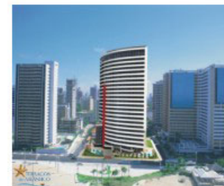
Perspectiva ilustrada do Terraços do Atlântico, na avenida Historiador Raimundo Girão, em frente ao mar.